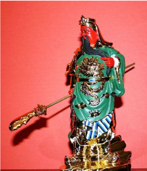
Kuan Kung: el guerrero inmortal