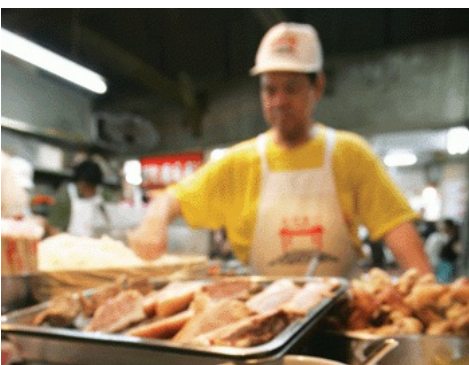
Los diez platos más populares en Taiwan