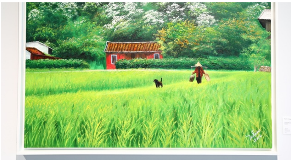
Epoca de las flores de Tung , óleo por Marta Chang de Tsien, 2016

En su intervención durante la ceremonia, la embajadora Chang de Tsien manifestó que “esta exhibición refleja las sólidas relaciones de diplomacia, amistad y cooperación que existen entre la República de China y las repúblicas de El Salvador y el Paraguay”. “Este año, con mi amiga Norma, hemos unido fuerzas para presentar algunas de nuestras obras y de algunos pintores profesionales de ambos países”, añadió la embajadora. Esta es la segunda exhibición de obras de arte de la embajadora Chang de Tsien en Taiwan.