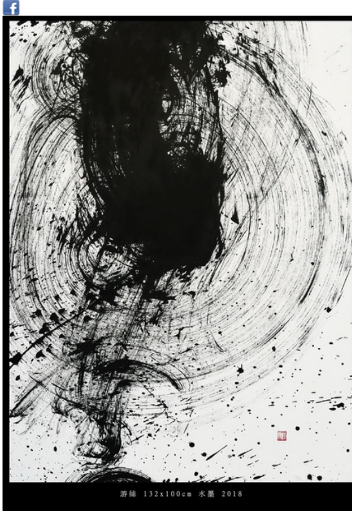
游絲 132x100cm 水墨 2018

水墨的潛能到底有多大？水墨在現代性的轉化中，從之前的“小型書寫”，無論是書法的個體表達還是筆會的交往場景，如何進入個體化的大型書寫？水墨並不拒絕表演化與行為化，在波洛克的滴灑行動繪畫之後，也給了水墨能量美學與身體表演的機會，儘管波洛克的滴灑行動也許還與中國傳統的潑墨隱秘相關。